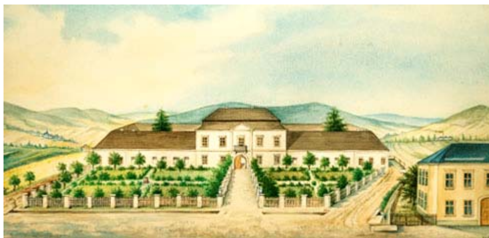
Monogramista WB, Terschův dvorec ve 2. čtvrtině 19. století, kolorovaná kresba.

Na počátku 30. let 19. století postavil Terschův syn Franz uprostřed severního křídla dvora klasicistní obytný dům. Celý komplex komentuje Řehoř Wolny ve své Topografii Moravy z roku 1839 jako "nový hezoučský Terschův dvorec". Jednopatrový dům měl pětiosé průčelí se zdůrazněným středem a s mansardovou střechou. Dodnes procházejí návštěvníci průjezdem tohoto domu, který je ukryt ve stávajícím paláci a vystupují do patra po jeho pískovcovém schodišti. Snad to bylo první samostatné obydlí mladého Tersche v Šumperku. Později rekonstruoval pro své potřeby starší domy uvnitř města (tzv. Geschaderův dům Kladská 1, a rodný dům na Starobranské 5 pro potřeby pošty, protože byl v letech 1847-1884 šumperským poštmistrem). Již ve 30. letech 19. stol. upravil patrně i prostory pro slušné ubytování zaměstnanců svého dvora. Nikoliv ratejnu, jak bylo tehdy zvykem, ale menší místnosti se samostatnými vstupy a kamny. Před severním křídlem dvora byly tehdy dvě geometricky členěné oplocené zahrady a mezi nimi vedla cesta.