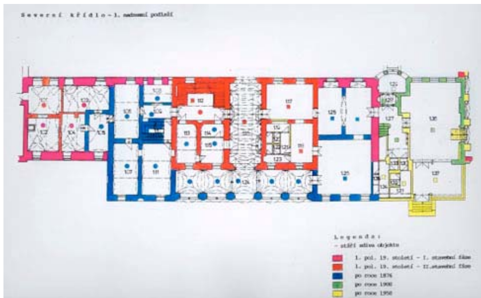
Stavební vývoj severního křídla Pavlínina dvora, první nadzemní podlaží (SHP, M. Filipová, 1995)

Palác má řadu zajímavých prostor, které jej předurčují k veřejnému využívání. Arkáda před vstupem do budovy zaujme v přízemí pěti poli české klenby. Valená klenba průjezdu, zdobená pásy s pilastry, je oddělena ode dvora vysokými prosklenými vraty, která sloužila již Terschově stavbě. Vstupní bohatě zdobené dveře jsou z 80. let 19. století. Vlevo od průjezdu je lehké a vzdušné halové schodiště s pískovcovými stupni a klasicistním litinovým zábradlím.