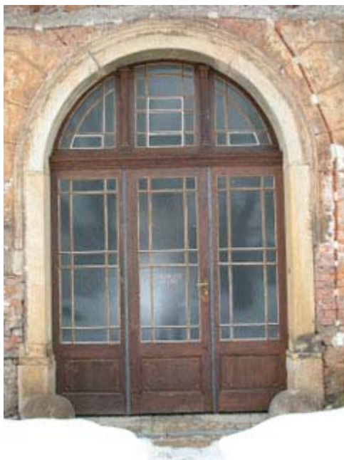
Klasicistní prosklená vrata z 30. let 19. století.

Palác má řadu zajímavých prostor, které jej předurčují k veřejnému využívání. Arkáda před vstupem do budovy zaujme v přízemí pěti poli české klenby. Valená klenba průjezdu, zdobená pásy s pilastry, je oddělena ode dvora vysokými prosklenými vraty, která sloužila již Terschově stavbě. Vstupní bohatě zdobené dveře jsou z 80. let 19. století. Vlevo od průjezdu je lehké a vzdušné halové schodiště s pískovcovými stupni a klasicistním litinovým zábradlím.