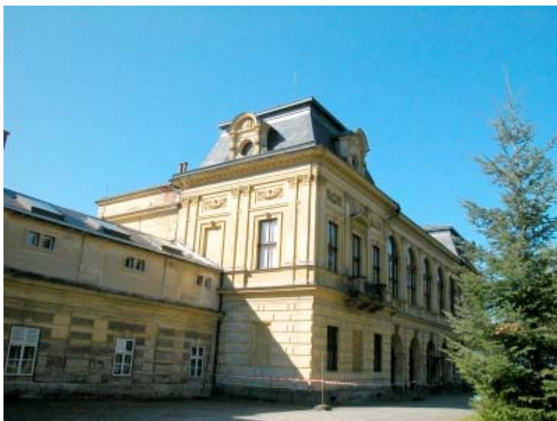
Pohled na novorenesanční palác před rekonstrukcí. Foto J. Mašek, 2004.