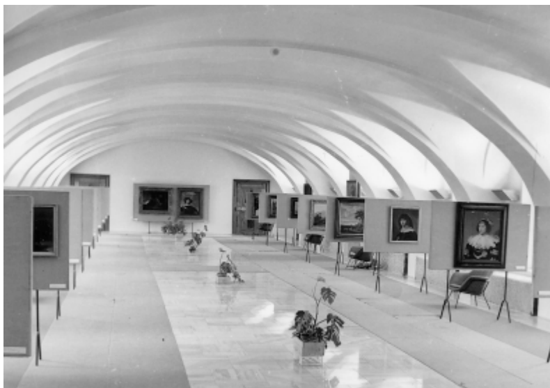
Výstavní síň v Pavlínině dvoře.

polovině východního křídla konferenční sál, výstavní síň a podkrovní vestavbu pro potřeby Okresního kulturního střediska.