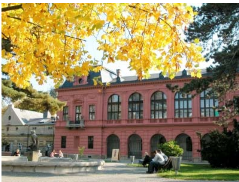
Novorenesanční palác Pavlínina dvora po restaurování fasády. Foto J. Mašek, 2005.

Práce na dalším využití areálu v Sadech 1.máje budou pokračovat. V roce 2006 bude provedena oprava dvorních fasád severního i východního křídla včetně dvorní fasády paláce. Ve východním křídle zřídí Město Šumperk ve spolupráci s VM Městskou galerií a ve své režii ubytovací prostory. V přízemí severovýchodního nároží dvora bude v nově vybavených prostorách Informační centrum, přednáškový sál a nové komunikační prostory, které propojí všechny expozice i pracoviště muzea.