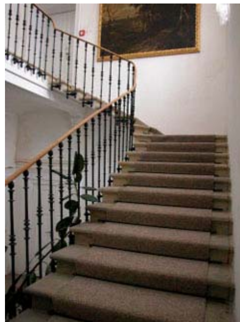
Klasicistní schodiště původního Terschova domu.

V přízemí napravo od vstupu je trojice sálů, z nichž jeden má strop, okna i dveře dekorativně obloženy dřevem. Z původního mobiliáře je zde novorenesanční, bohatě vyřezávaná kredenc. Z vybavení interiérů zůstalo velice málo předmětů, ale dle bohatě zdobené fasády doplněné plastikami, lze předpokládat i exkluzivní vnitřní vybavení, doplněné uměleckými díly. Dochoval se jich jen zlomek, například litinová socha Tance na schodišti nebo několik secesních svítidel. Z vybavení parku zůstala ve sbírkách muzea kovová socha Žně z fontány před palácem. Nárožní sály v patře včetně arkádové galerie převyšují výšku stropů ostatních místností v poschodí. Sály jsou zaklenuty "falešnou" zrcadlovou klenbou bohatě